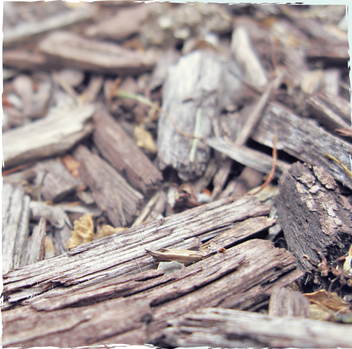
BIOMASSA: I carburanti liquidi a basso contenuto di carbonio, ottenuti da biomassa sono carburanti liquidi sostenibili con emissioni nette di CO 2 nulle o molto limitate durante la loro produzione e il loro utilizzo rispetto ai carburanti di origine fossile.

L'industria della raffinazione dell'Ue è pronta a intensificare la collaborazione con le altre industrie e con i decisori politici europei, per intraprendere insieme un'azione coraggiosa per il clima. Al fine di realizzare trasporti neutrali dal punto di vista climatico entro il 2050, invitiamo i decisori politici della Ue a instaurare nel 2020 un dialogo ad alto livello con tutte le parti interessate per definire il necessario quadro politico. I seguenti principi chiave sono fondamentali per realizzare la nostra ambizione di neutralità climatica entro il 2050 e dovrebbero servire come punto di partenza per la discussione: